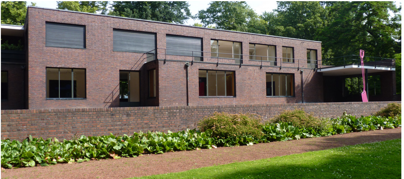
Haus Lange in Krefeld