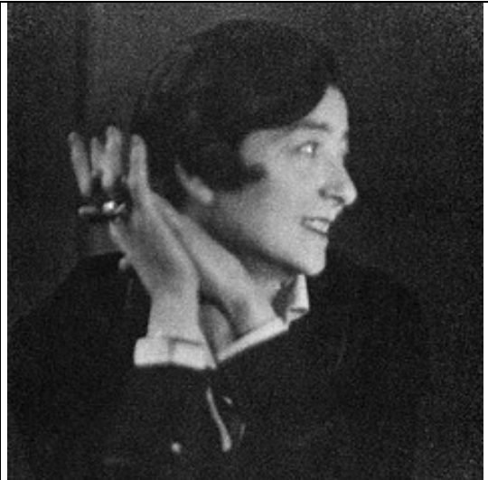
Eileen Gray 1878 - 1976.