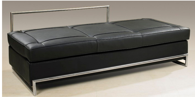
Daybed Sofa 1925