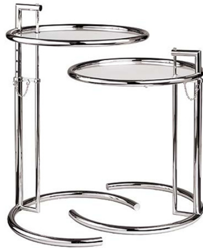
Adjustable Table 1927

Eileen Gray wurde am 9. August 1878 in Irland geboren und starb dort am 31. Oktober 1976. Sie war eine irische Innenarchitektin und gehört zu den wichtigsten Designerinnen des frühen 20. Jahrhunderts.